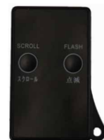
別売りのリモコン

http://www.select-solala.co.jp 〒212-0024 神奈川県川崎市幸区塚越 3-402 TEL 044-542-9840 FAX 044-542-9841