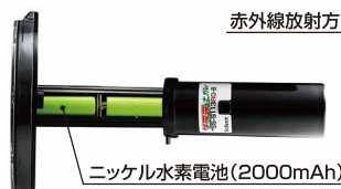
ニッケル水素電池(2000mAh)

天候不順でソーラー充電が不十分な時でも、新型電池ケースの採用により専用充電器で簡単に充電できます。